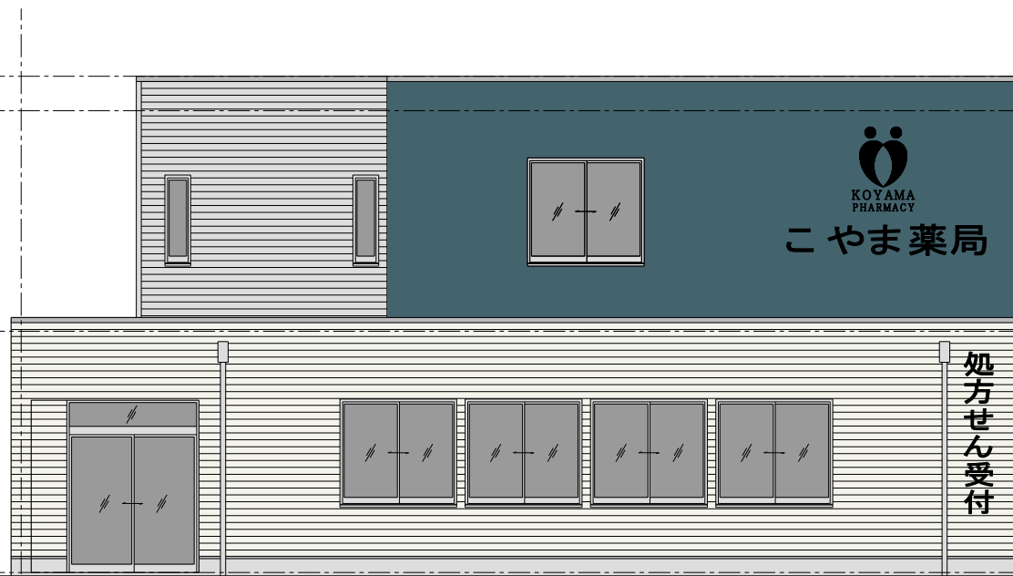
南立面図 S ; 1 / 100